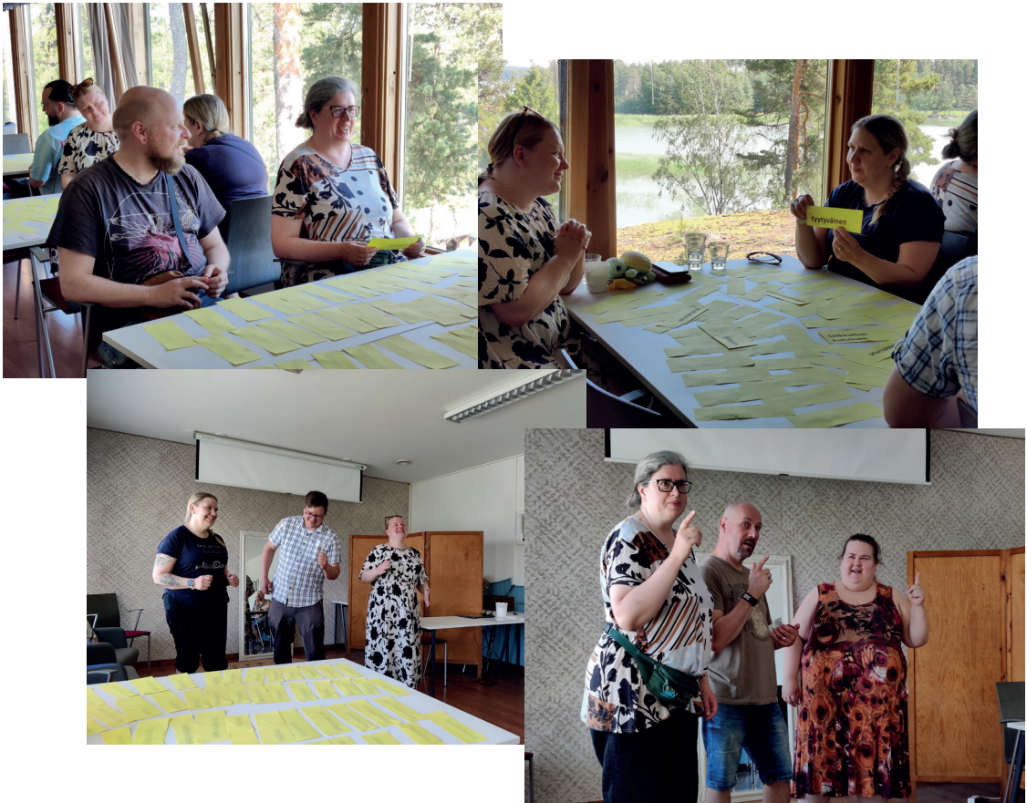
Kesän tukipäivillä mm. esitettiin tunteita sanattomasti kehon kielellä.

Mitä tunteita äänet meissä herättävät? Tai yrittävätkö äänet ilmaista jotakin sellaista tunnetta, jota meidän on vaikea hyväksyä? Miten äänet reagoivat positiivisiin tunteisiimme?